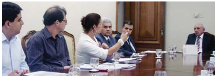
2/9/2010: reunião de negociação com presidente (então) recém-eleito, desembargador Cláudio Costa

A ções na ALMG: o segundo semestre não começou muito diferente: reuniões, conversas, mas poucos resultados efetivos em relação aos itens ainda faltosos de atendimento em NOSSA Pauta/2010. A chegada do novo presidente do TJ, desembargador Cláudio Costa, trouxe novas aflições. Para agitar o que já estava aflitivo, ainda tivemos de lidar com inquietações decorrentes de imposições do Conselho Nacional de Justiça (CNJ) - quem não se lembra do sufoco na tentativa de ampliar nossa jornada, SEM REAJUSTAR VENCIMENTOS? (que necessitou também de muita ação NOSSA - na Corte e em gabinetes de magistrados, entre outras). Os que achavam que, com os resultados obtidos no TJMG (fruto das lutas