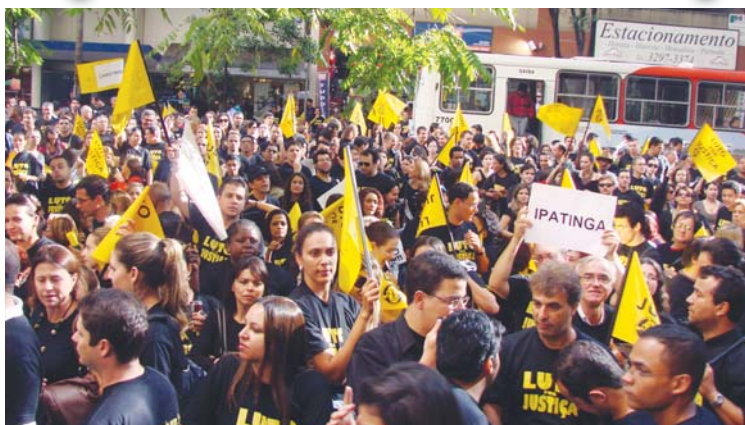
12/5/2010: representantes de diversas Comarcas comparecem à mobilização em BH. No interior, mais força, também com movimentos e paralisações.

Primeiro semestre intenso: Iniciamos 2010 na mesa de negociação. A despeito desse esforço do SERJUSMIG, empenhando-se em soluções dialogadas , houve pontos de tensão entre os servidores ao longo de 2010. No primeiro semestre, em diversos momentos, a ausência de bons resultados nas negociações, ou mesmo o “surgimento de novos problemas” (como ameaças de cortes de direitos e ampliação de jornada; aliadas à insegurança; desvalorização e afins) levaram a categoria a reagir com mais veemência.