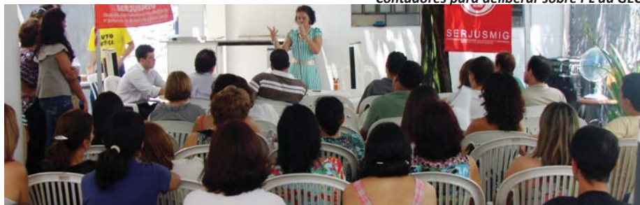
4/12/2010: reunião de Escrivães e Contadores para deliberar sobre PL da GEC

Os presentes, então, deliberam que o SERJUSMIG negocie, na ALMG, a proposição de duas emendas. Na primeira, retomar a PROPOSTA DEFENDIDA, desde 2007, pelo NOSSO Sindicato: 20% sobre o PJ 77 . Na outra, explicitar que a implementação da GEC não pode, em hipótese alguma, resultar em diminuição dos valores recebidos, atualmente, a título de substituição. As emendas passam pelas duas primeiras Comissões. Mas, na última (Fiscalização Financeira: FFO), a decisão da Mesa da AL é de oficiar o TJ sobre as emendas (a fim de buscar um posicionamento consensual). Ou seja, tal projeto (Gratificação de Escrivães e Contadores), certamente, já é parte da Pauta de LUTAS que nos aguardam em 2011! Isso sem falar que o Tribunal retirou o PL do 3º grau para Oficiais. Ou seja, teremos mais trabalho (neste ponto) e também em relação ao efetivo pagamento do Adicional de Periculosidade. S