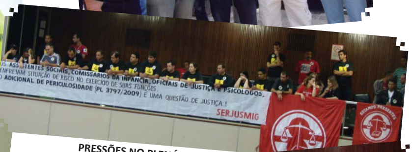
PRESSÕES NO PLENÁRIO