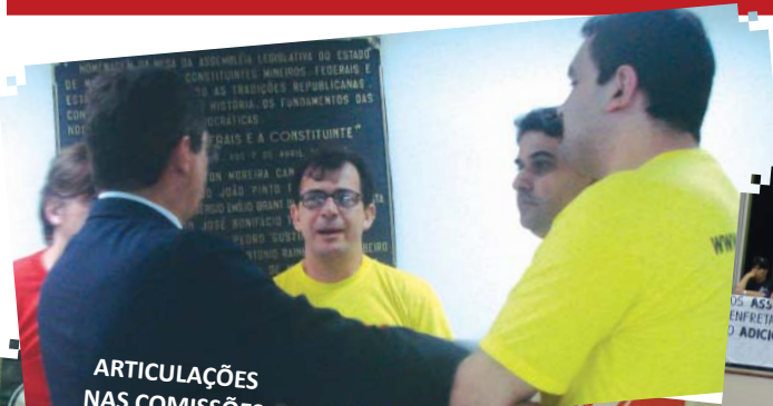
ARTICULAÇÕES NAS COMISSÕES