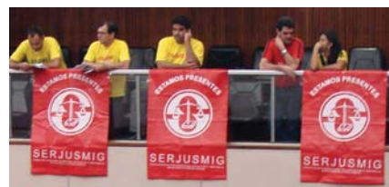
Novembro/2010: um de nossos incontáveis PLANTÕES no Plenário da ALMG, realizados em todos os turnos e reuniões

estariamos de volta: e "NÃO DEU OUTRA!" Voltamos, negociamos, protestamos, pressionamos (diária e incansavelmente). Em nossa retomada de ações na ALMG, vieram novos desafios: briga pelo PL contra o "Assédio Moral"; pela emenda que apresentamos ao Projeto do 3º Grau para Oficiais de Justiça (PL 4631: retirado de tramitação pelo TJ - detalhes no site www.serjuszmg.org.br ); além da "surpreendente" decisão da Corte Superior do TJ (de 24/11) em enviar ao Legislativo os PLs da Gratificação-Chefia (GEC) e da ampliação do adicional de Periculosidade (mas sem acatar percentuais/padrões propostos - e há anos - pelo SERJUSMIG: detalhes no site www.serjuszmg.org.br ).